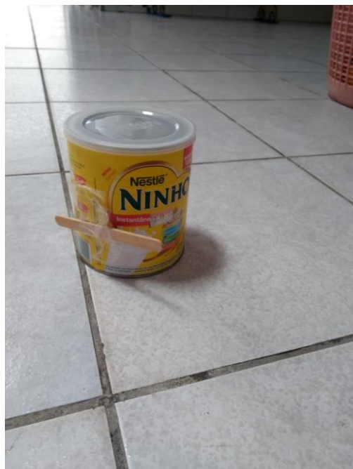
Figura 5 – Robô de lata, criação de Kaique, 6 anos

Além dessas produções, os meninos criaram chocalho com garrafa pet e grãos de feijão, pato (uma bola amarela), balão, robô de lata, e enfeite para casa. Já as meninas, criaram bolsa, pulseira, máquina de corações, Araci fez um colar após observar Tainá fazer um e Moema fez um robô de plástico após observar o robô de lata de Kaique.