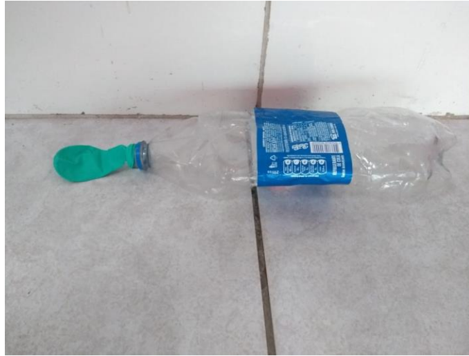
Figura 1 – “enchedor de bola”, criação de Kadu, 5 anos