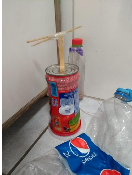
Figura 4 – Helicóptero, criação de Juraci, 6 anos