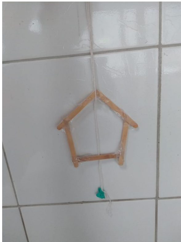
Figura 9 – Enfeite de casa, criação de Peri, 5 anos