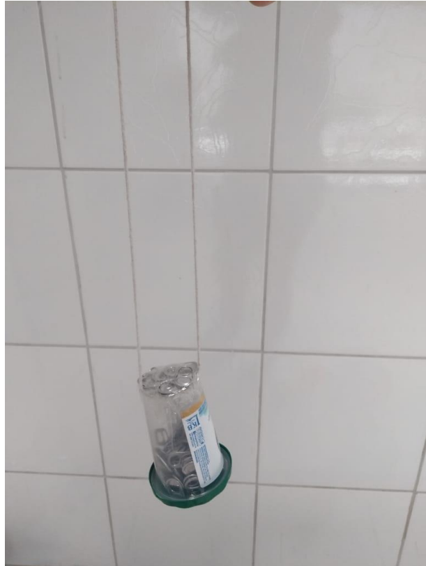
Figura 10 – Bolsa, criação de Iracema, 5 anos