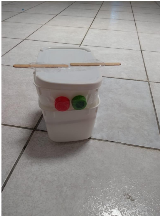
Figura 6 – Robô de plástico, criação de Moema, 6 anos