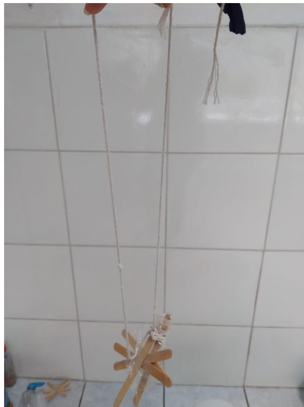
Figura 11 – Colar, criação de Araci, 5 anos