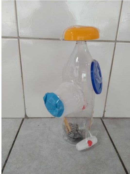
Figura 8 – Máquina de corações, criação de Yara, 5/6 anos