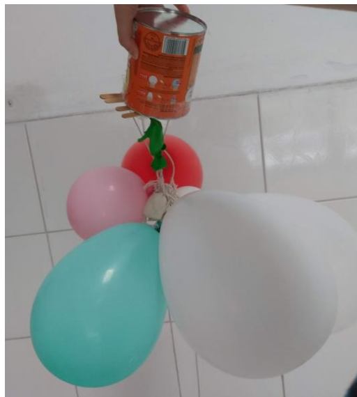
Figura 2 – Polvo, criação de Ubiratã, 5/6 anos

Ubiratã foi um dos garotos que participou dessa brincadeira e uniu várias bolas criando um trem. Depois de brincar bastante com seu trem, Ubiratã pegou uma lata e criou um polvo.