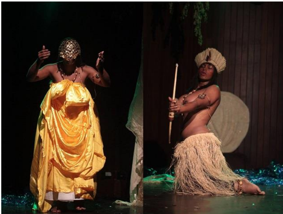
Figura 4- Apresentações do Trans Show no ano de 2014.

mostrando que talvez haja uma despreocupação com a questão racial no mesmo, ainda que a juventude negra (e LGBT) no estado esteja sendo assassinada dia após dia.