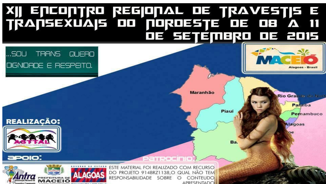
Fig. 2- Cartaz de divulgação do XII Encontro Regional de Travestis e Transexuais do Nordeste financiado através de projeto submetido ao Ministério da Saúde

Já o segundo projeto foi aprovado através de edital que se destinava a seleção de organizações da sociedade civil para realização de testagem por amostra de fluido oral do HIV nas populações-chave, este também foi publicado pelo Ministério da Saúde (MS), por meio do Departamento de DST, Aids e Hepatites Virais (DDAHV) da Secretaria de Vigilância em Saúde (SVS), e a Organização das Nações Unidas para a Educação a Ciência e a Cultura (UNESCO). O projeto, que tem como slogan “Viva Melhor Sabendo” (Figura 3) está sendo realizado desde 2015 e tem permitido que algumas travestis e transexuais se insiram no campo do trabalho, além de favorecer a participação das mesmas em reuniões do Conselho Estadual LGBT, para além da realização de testagens correlatas ao projeto.